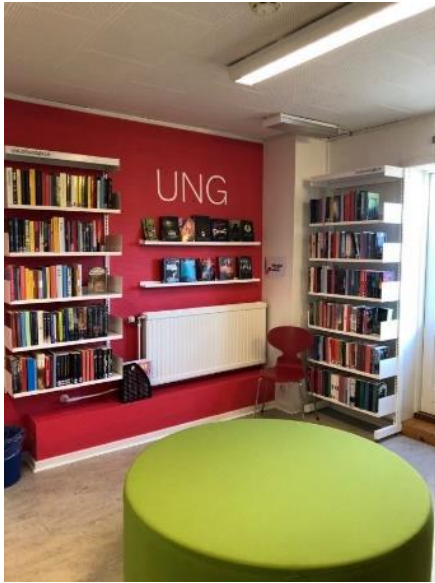
Verandi umstøður hjá ungdóminum á Býarbókasavninum

Leingi hevur verið tørvur á, at ungdómurin fær meiri pláss og betri umstøður á Býarbókasavninum. Tórshavnar býráð játtaði í apríl 2020 eina upphædd at skapa spennandi karmar um eina nýggja ungdómsdeild á Býarbókasavninum. Ætlanin er at skapa eitt spennandi stað, sum bara er til tey ungu, sum hava verið fyri vanbýti á Býarbókasavninum. Í 2020 varð farið undir verkætlanina, og væntandi verður arbeiðið liðugt í 2021.