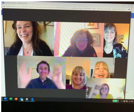
Ein av lesiringunum hittist á Zoom

Tíbetur vóru vit í tí hepnu støðu, at bókasavnið longu hevði sera góðar nettænastrá at veita teimum bókasavnsheingrandi, nú møguleikarnir at koma á bókasavnið vóru so skerðir. Hetta merkti, at talið á útlæntum netbókum og serliga ljóðbókum, sum bókasavnið lænir út umvegis donsku bókasavnskipanina eReolen, hækkaði munandi hesa tíðina.